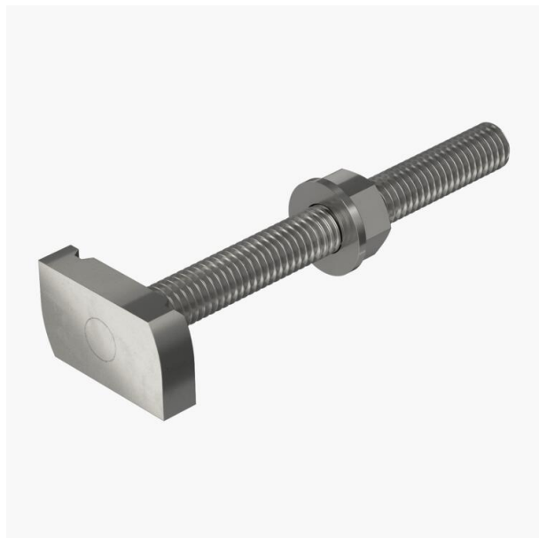
Hammerbolt til anvendelse med profilskinne MS4121 og MS4141